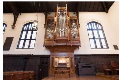
ティッケルオルガン