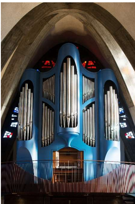
フィスクオルガン

2018年に再来日し、現在、立教女学院オルガニストを務める傍ら、楽譜輸入販売“GAUDEAMUS”を設立し、日本におけるオルガン音楽・教会音楽の普及に尽力している。